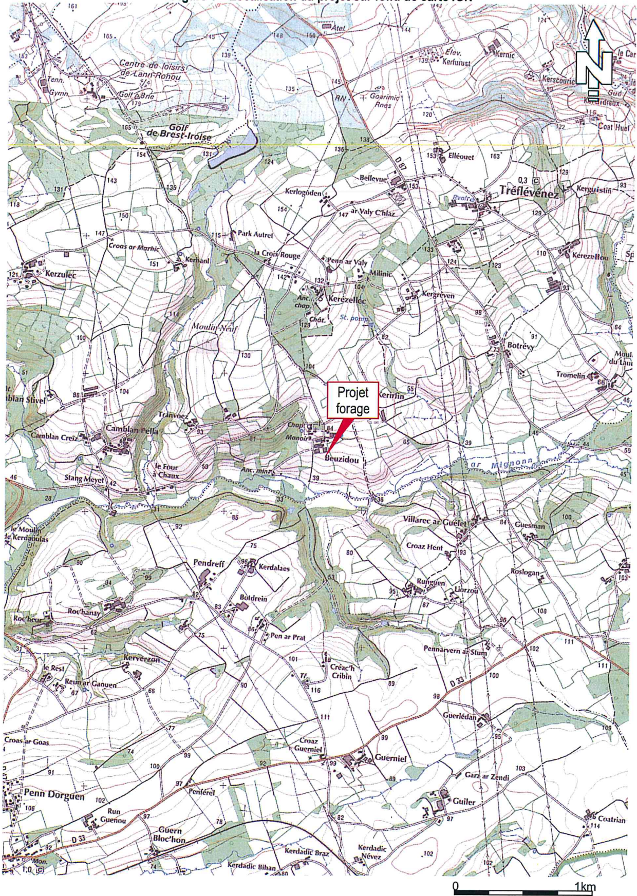
Figure 1 – Localisation du projet sur fond de carte IGN