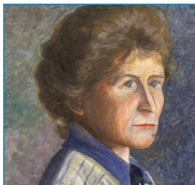
PORTRAIT DE MARIE LE GAC-SALONNE PEINT PAR SA FILLE, LOUISE-YVONNE SALONNE, EN 1922

Certains sujets défendus dans ses articles ont débouché sur des victoires pour la cause féministe, notamment la liberté pour les femmes de disposer de leur salaire, le congé de maternité, la recherche de paternité et, plus tard, la nomination des femmes au gouvernement. Elle décède en 1974 à Saint-Cast (Côtes d'Armor).