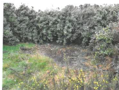
Parcelle DW 68