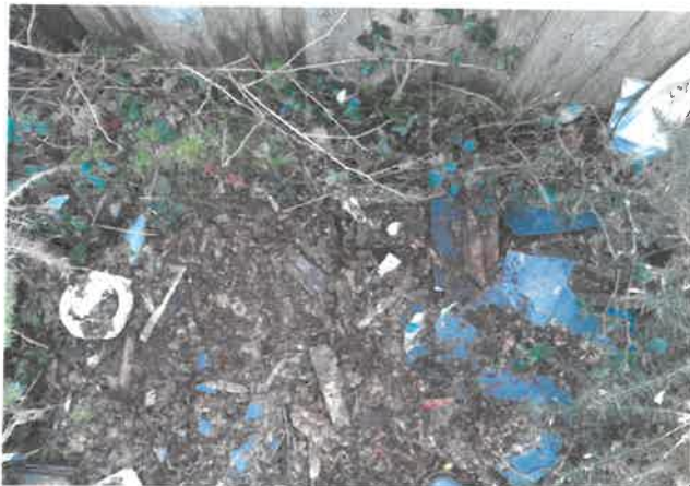
Parcelle DW 76