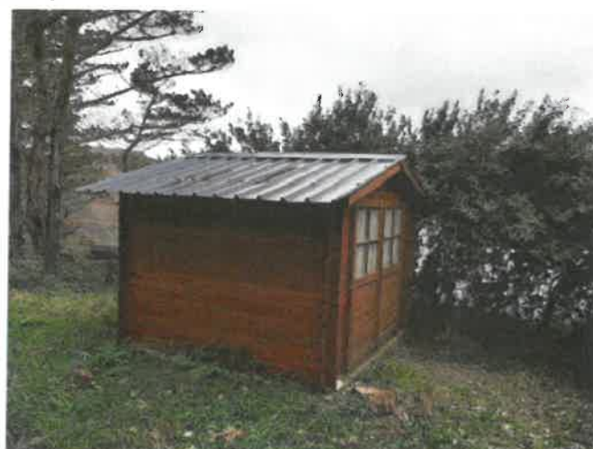
Parcelle DW 71