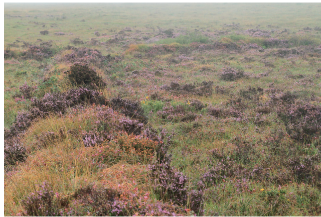
Tourbière du Venec