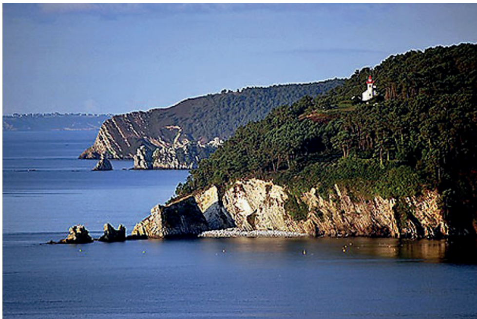
Pointe de Morgat (Crozon)

Une OGS est donc une démarche de développement touristique durable, qui vise à maintenir ou restaurer la qualité paysagère du site, tout en permettant le développement du tourisme.