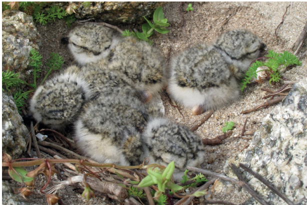
Pousins grand gravelot (25 % des effectifs nichent dans l'archipel de Molène)

Le Parc naturel marin d'Iroise, gestionnaire pour le compte de l'État, rend compte chaque année, à un comité consultatif multi-acteurs, de la manière dont il décline le plan de gestion de l'espace classé.