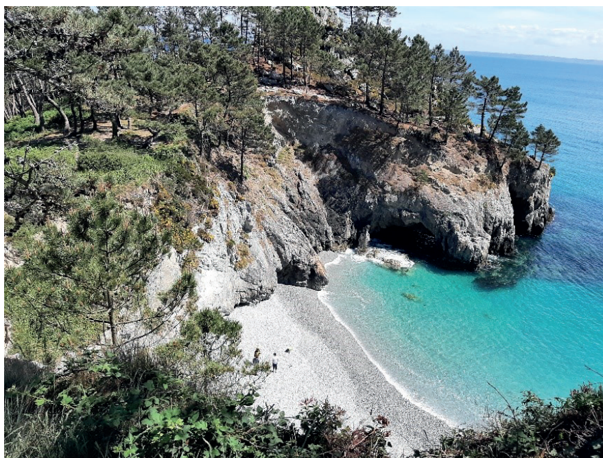
Plage de l'Île Vierge

Cet aménagement devra concilier les problèmes de sécurité, de stationnement et d'accès des touristes mais aussi des riverains, de préservation des espaces naturels et du caractère naturel du site. Il devra, en outre, être compatible avec la géologie et les risques d'érosion du site liés aux ruissellements par exemple, et prendre en compte le risque feux de forêts qui va sans doute s'accroître sachant que ce secteur est sensible en raison de sa configuration et de sa fréquentation estivale.