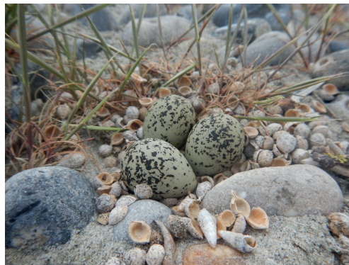
Poussin et œufs de gravelot à collier interrompu.