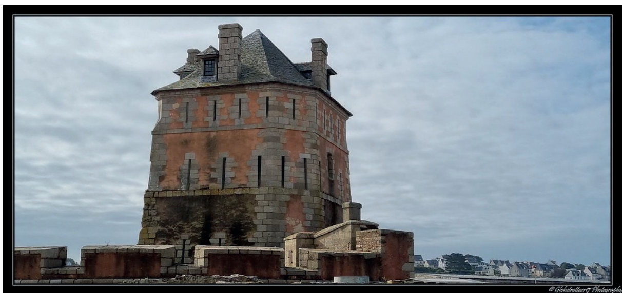
Tour Vauban (Camaret-sur-Mer)