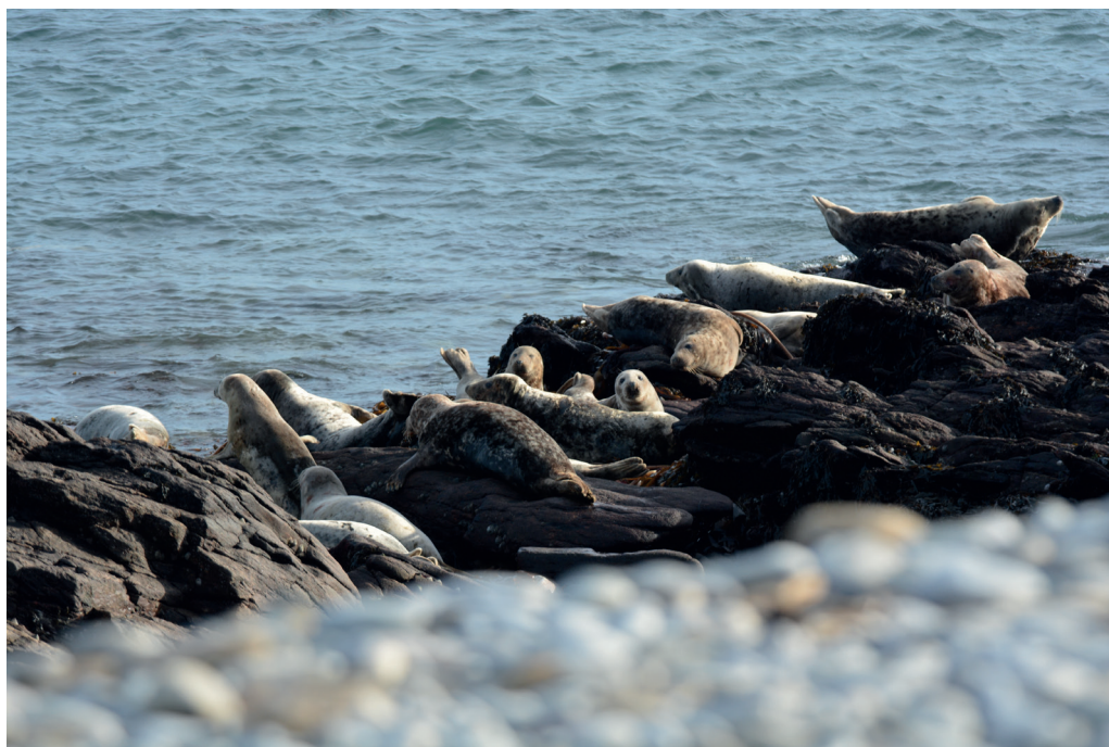
Phoques gris sur leur reposoir de l'archipel de Molène La RNN d'Iroise est le premier site breton en termes d'effectifs de phoques gris et le deuxième site de naissances.

Le Finistère comprend également deux réserves naturelles régionales : Cragou-Vergam et celle de la Presqu'île de Crozon en faveur des sites géologiques.