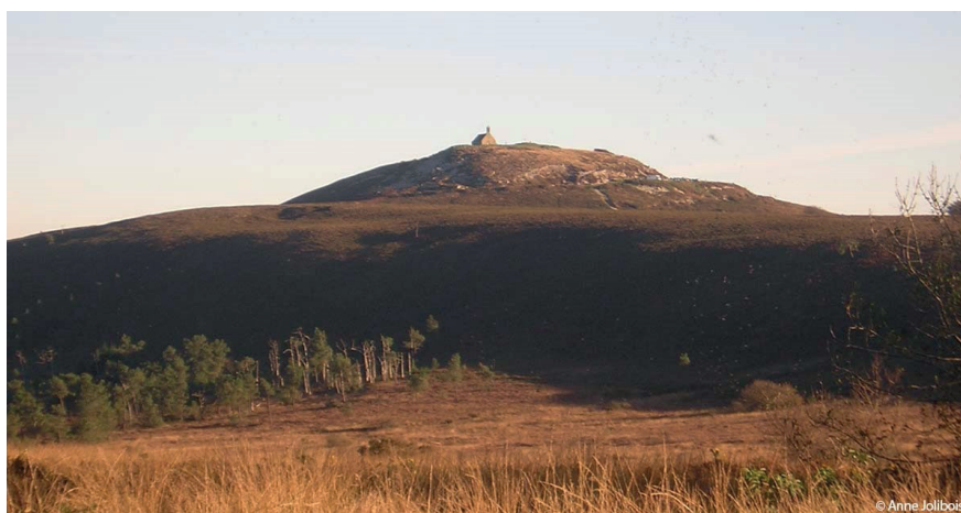
Mont et chapelle Saint-Michel (commune de Saint-Rivoal)