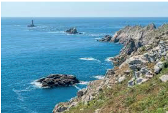
La Pointe du Raz

La démarche de demande du renouvellement du label Grand Site de France au site de la Pointe du Raz en Cap Sizun devra bientôt être engagée sur la base du bilan de la période en cours et d'un projet global, concerté et réaliste de gestion et de valorisation du territoire. Il s'agit de proposer une vision inscrite dans un temps long, approprié aux enjeux du site et s'inscrivant en cohérence avec les finalités d'un grand site.