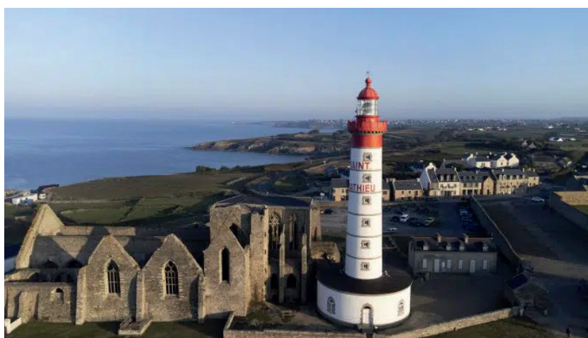
La Pointe Saint-Mathieu

Sur la base du dossier transmis par le préfet au ministère en charge de l'écologie, la procédure suit son cours au niveau national par la présentation du projet aux membres de la Commission Supérieure des Sites, Perspectives et Paysages (CSSPP) et l'examen par le Conseil d'État avant la décision de classement.