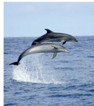
L'archipel des Glénan