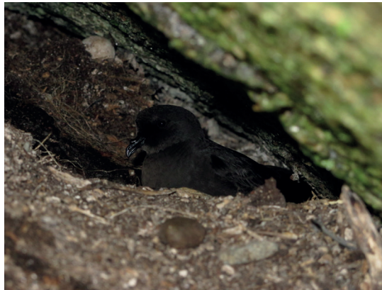
Océanite tempête au nid (80 % des effectifs nationaux nichent dans l'archipel de Molène)