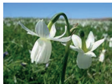
Narcisse des Glénan