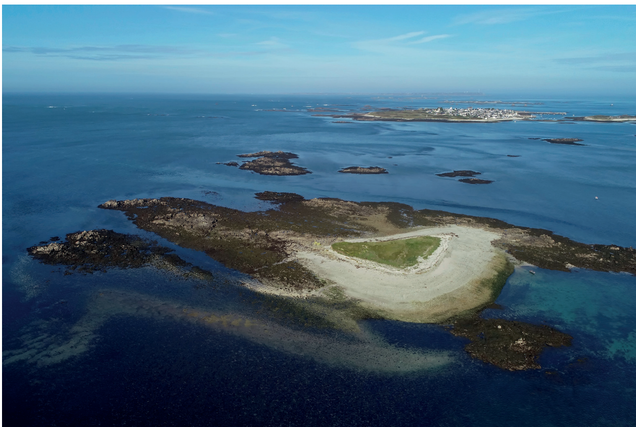
Vue de l'archipel de Molène