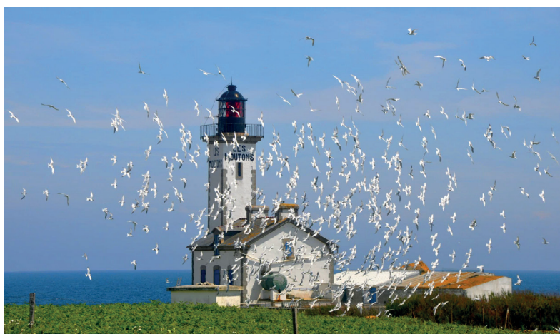
Le phare de l'île des Moutons

La phase de concertation, pilotée par l'État, qui a débuté à l'automne 2022 avec l'ensemble des acteurs locaux va se poursuivre durant encore plusieurs mois afin de construire localement, le plus collectivement possible et avec le maximum de pédagogie, un avant-projet de dossier qui sera soumis à la procédure réglementaire.